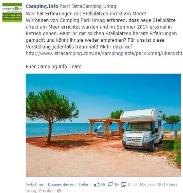
Beispiel für ein Facebook-Posting

Zeitgleich mit dem Posting auf Facebook wird dieses auch auf der Google+ Seite von Camping.Info veröffentlicht ( https://plus.google.com/+campinginfo/posts ). Das Posting wird ebenfalls mit einem Link direkt auf Ihre Homepage versehen.